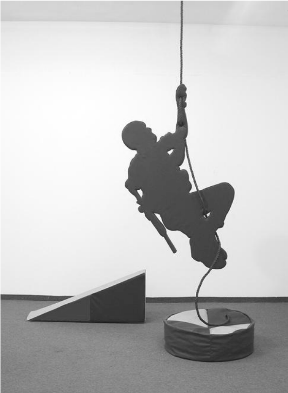
אדווה קרני, 'ג'ימבורי' (פרט), ספוג, בד וחבל, 300X300 ס"מ, 2006.