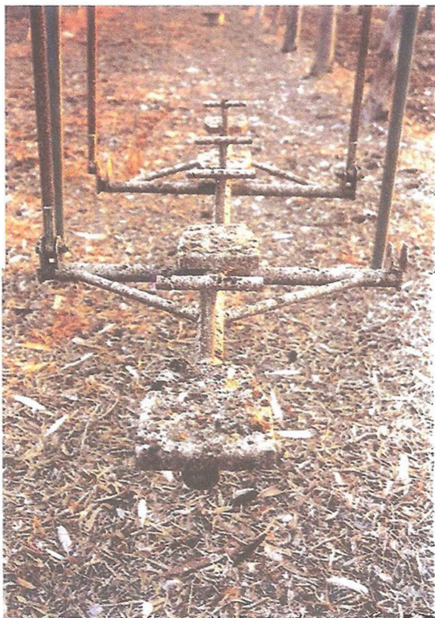
למעלה: אדוה קרני, ג'ימבורי, ספוג, בד וחבל, 300X300 ס"מ, 2006. משמאל: נועם הולדנגרבר, נדנדה, צילום, 90X60 ס"מ, 2002.