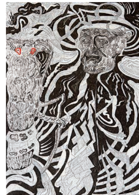
נועם עומר, ללא כותרת , 2019, דיו על נייר, 100x70