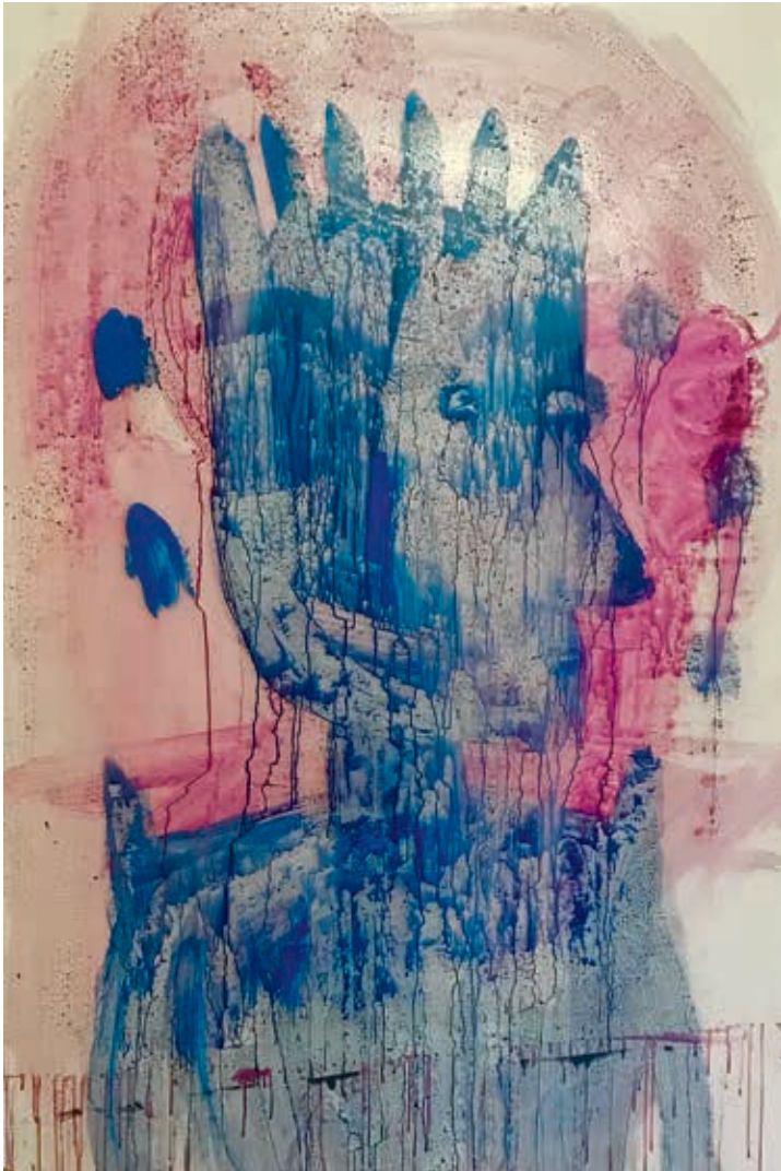
איחי רוין-גלבע, זייט מהגיהינום , 2021, אקריליק על ניילון, 250x150 → איחי רוין-גלבע, זולג , 2021, מוטוח ברזל וקרטון (פרט)