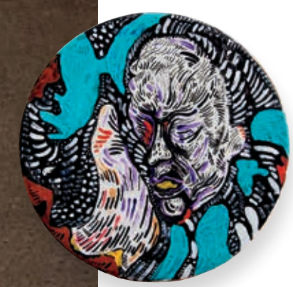
↑ נועם עומר, נפילים בפורצלן, 2021, דיו ואקריליק על פורצלן, קוטר: 30 כ"א ← מראה הצבה במערוכה