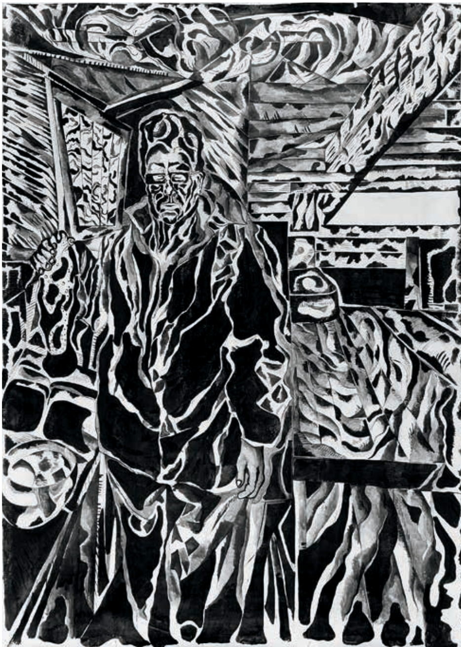
נועם עומר, אבא עם דג, 2015, דיו על בד, 220x160

המילה "נפילים" מוזכרת לראשונה בספר בראשית (ו', ד'): "הַנְּפִלִים הָיוּ בְּאֶרֶץ כְּנָעַן הַקְּדִמָּה הַקְּדִמָּה". הסיפור המקראי אינו מגדיר את זהותם. לפי גרסה אחת, הנפילים היו מלאכים שירדו לארץ ולקחו להם בנות תמותה. לפי גרסה אחרת, הם היו פירותיהם של אותם זיווגי כלאיים אסורים.