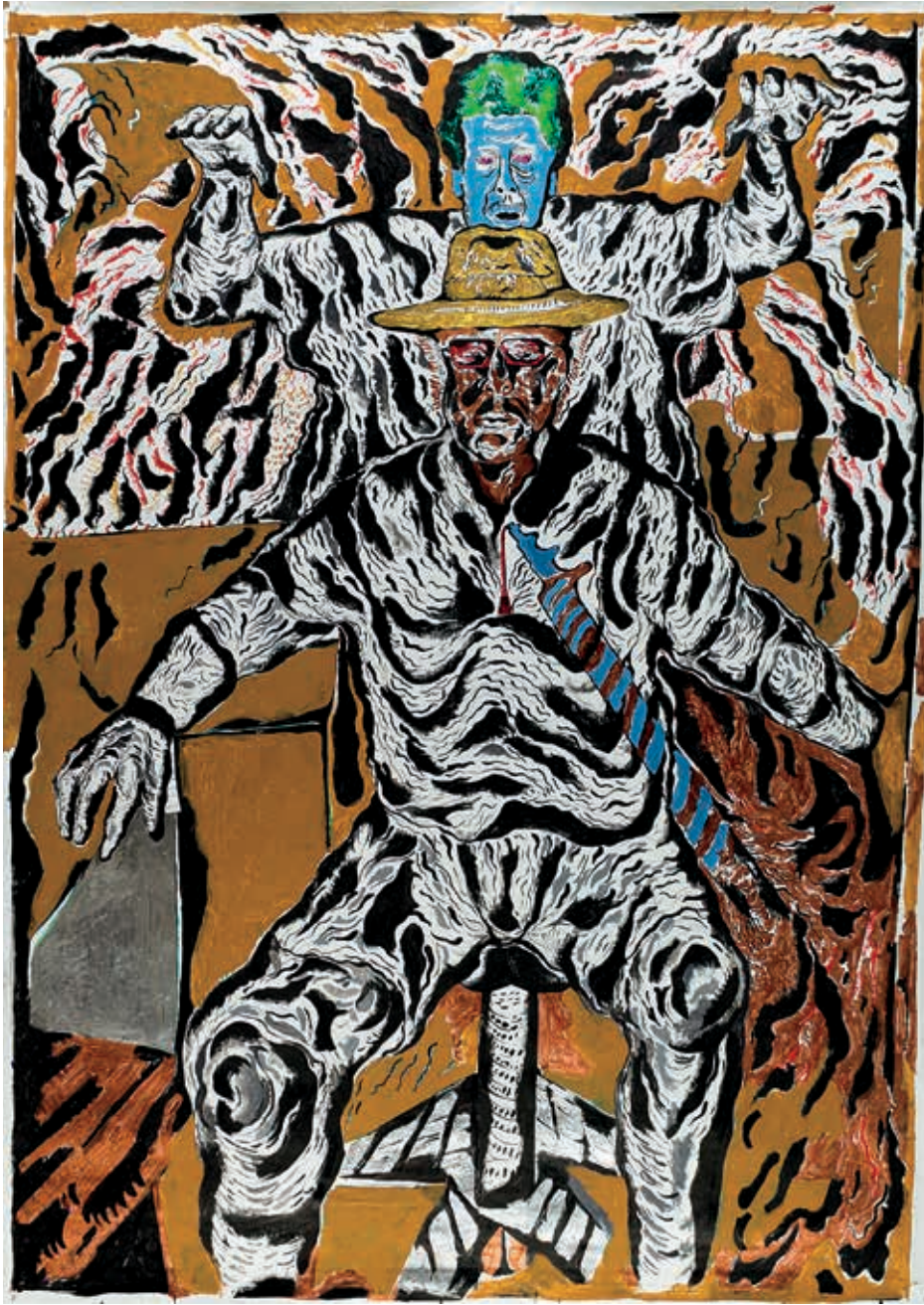
נועם עומר, אבא-משה, 2014, אקריליק ודיו על בד, 220x162

המבול בעבודותיו של עומר מתגלה לא רק בתוכן המאיים, אלא גם בגודש, המציף את הצופה ומאיים לקבור אותו תחתיו. עומר נתון במאבק מתמיד, שבו המבול חוזר ומתרגש עליו מדי יום, והוא צריך לשרוד כל פעם מחדש, לצוף ולהשיג סדר כדי לא לטבוע. גם בניינים גבוהים הם מבחינתו נפילים, כלומר יצורי ענק מאיימים, שמולם הוא מתכווץ בפחד ממשי. האיכות המפלצתית של הנפילים אינה קשורה רק לממדיהם הענקיים, אלא גם לטבעם הבלתי מוגדר. דמויות הנפילים מייצגות זהויות נזילות ומעורבבות. אלו הן דמויות כלאיים מוקצנות, מוטציות בלתי יציבות.