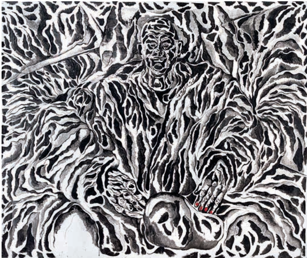
נועם עומר, דמיאניקו , 2014, דיו על בד, 132x160