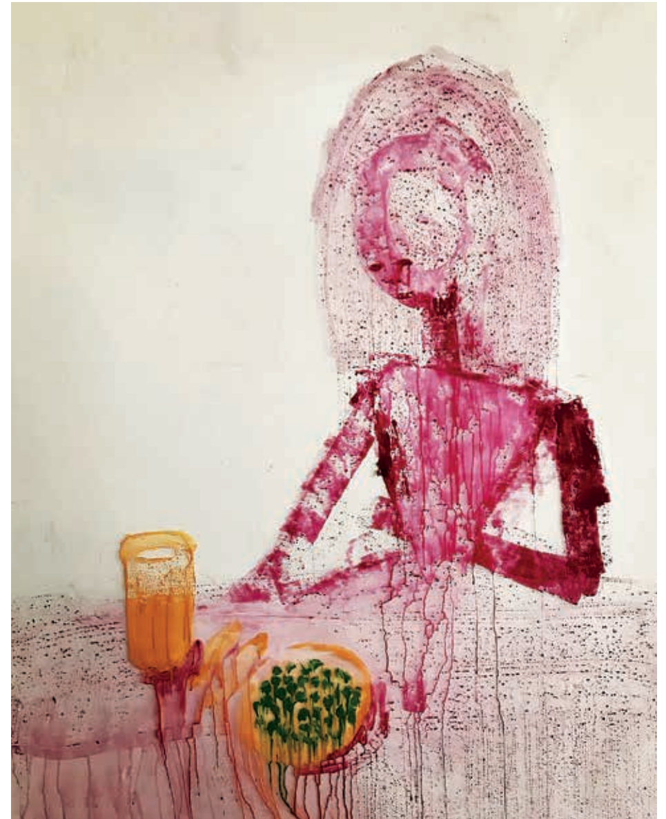
איתי רוין-גלבע, אפונה, 2021, אקריליק על ניילון, 250x150