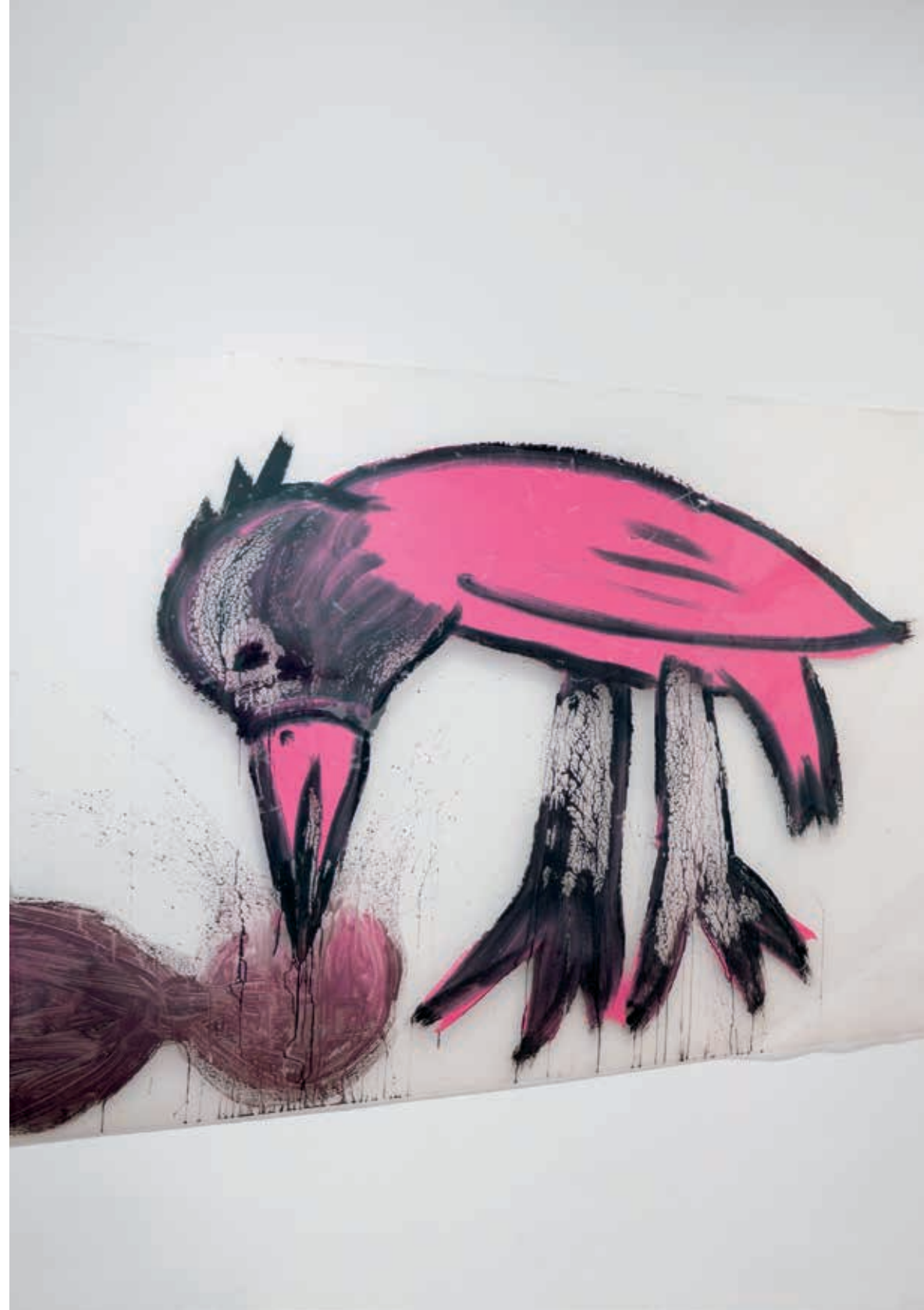
→ איחי רוֹן־גלבע, גלגל, 2021, אקריליק על ניילון, 150x300 (מראה הצבה בתערוכה)

הרישומים נדמים לסימני כתב, לשפה, משל היה כל רישום מילה, והחיבור ביניהם – משפט שלם, כמעין כתב הירוגליפי. התמצות הלשוני בא לידי ביטוי הן ברישומים והן באובייקטים, המסמלים ייצוג של מילה או של רעיון. בכתב סימנים מסוג זה יש היבט דוקטיבי, המתייחס למציאת העיקר. גם הפיסול של רוֹן־גלבע מנסה לעסוק בעיקר, ולא בטפל: במצבו המהותי.