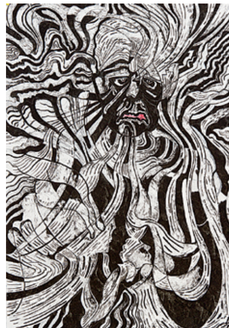
נועם עומר, ללא כותרת , 2019, דיו על נייר, 100x70