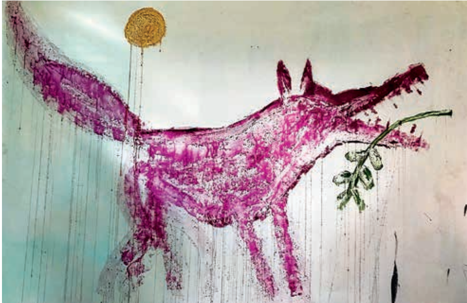
איתי רוין-גלבע, זאב שלום, 2021, אקריליק על ניילון, 150x250 איתי רוין-גלבע, מראה הצבה בתערוכה ←