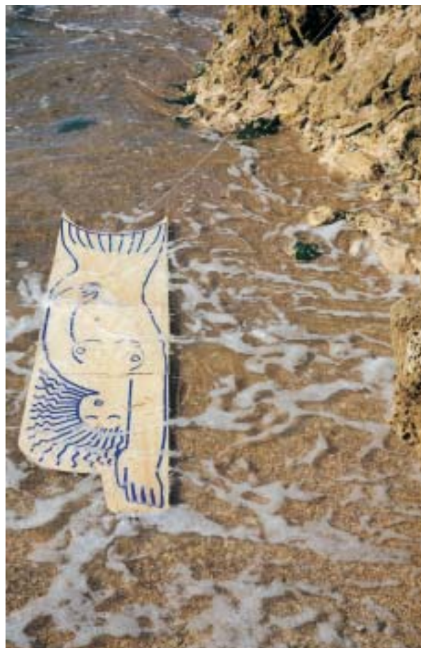
סירנה , 2004, עט סימון על דיקט, חוף סידנא עלי