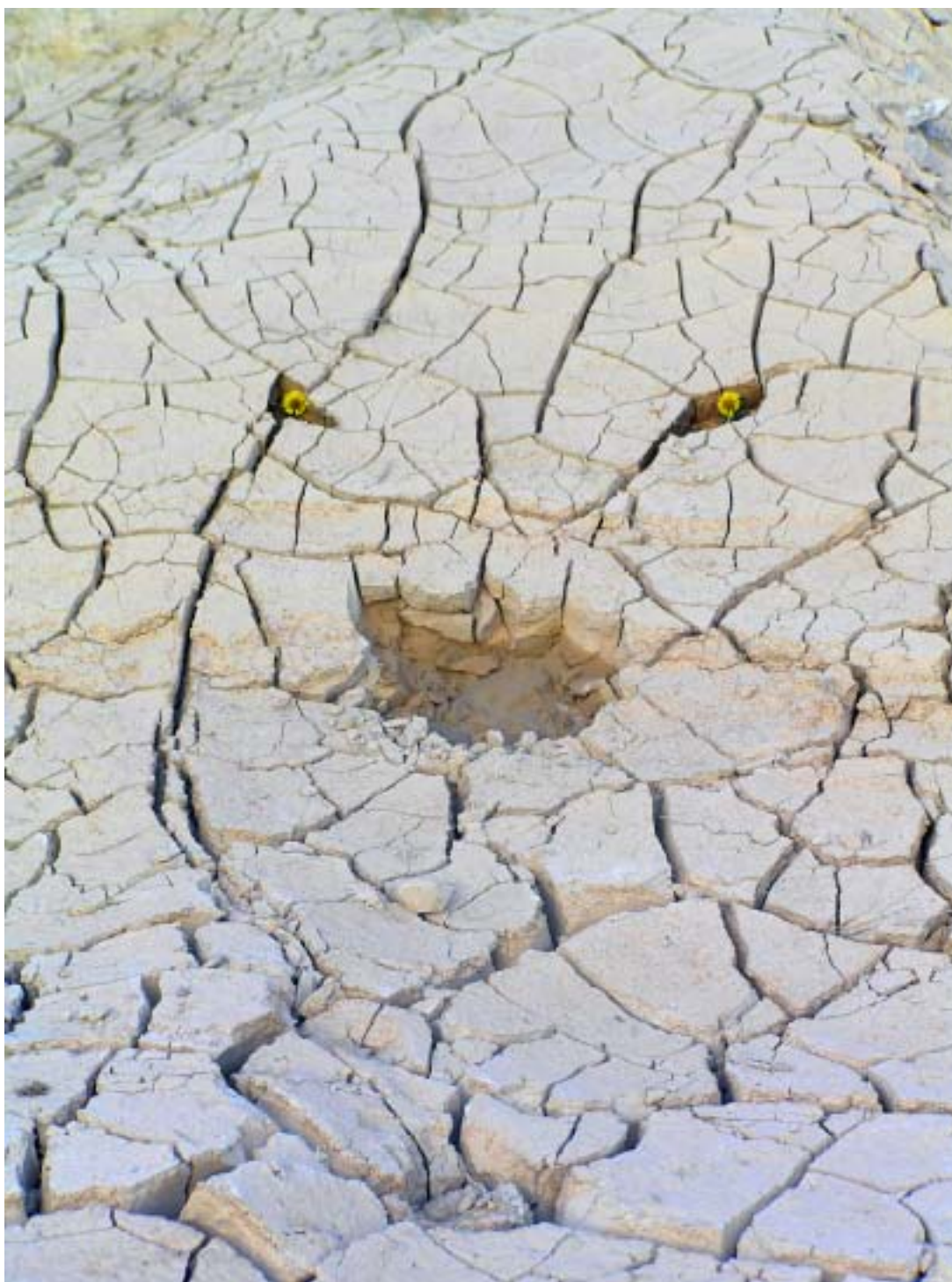
אדם, 2006, אדמה, פרחים ומים, שפך נחל רחף