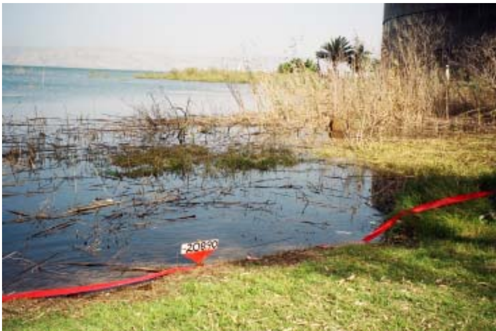
הפרח , 2002, עט סימון על קרטון פלסטי, למרגלות הר בריניקי הקו האדום העליון של הכינרת (הישן) , 2004, סרט סימון, עין גב