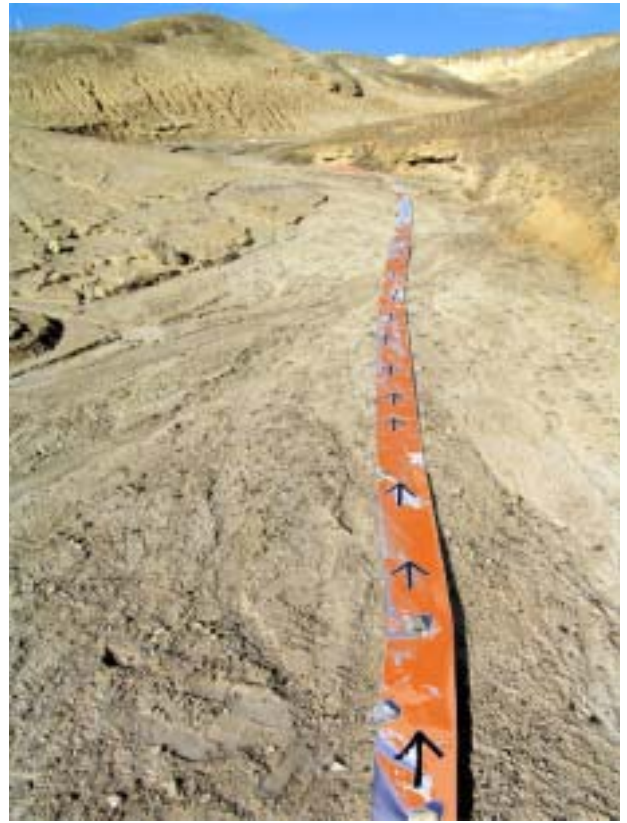
סימני דרך 1, 2005, עט סימון על נייר רציף, הר סדום