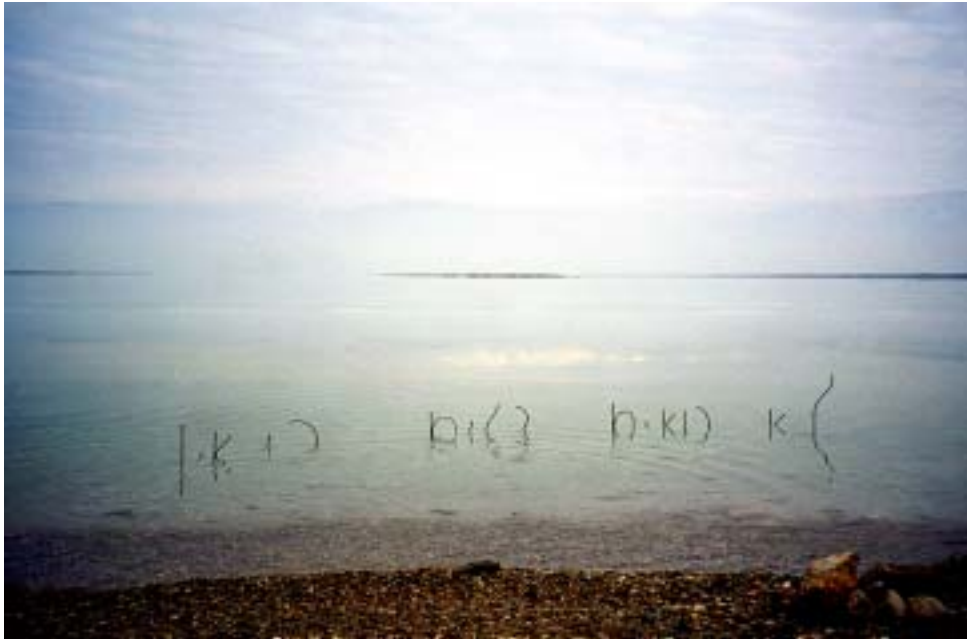
לא רואים דגים כי אין, 2003, מוטות פלדה עומדים בים המלח, חוף עין בוקק