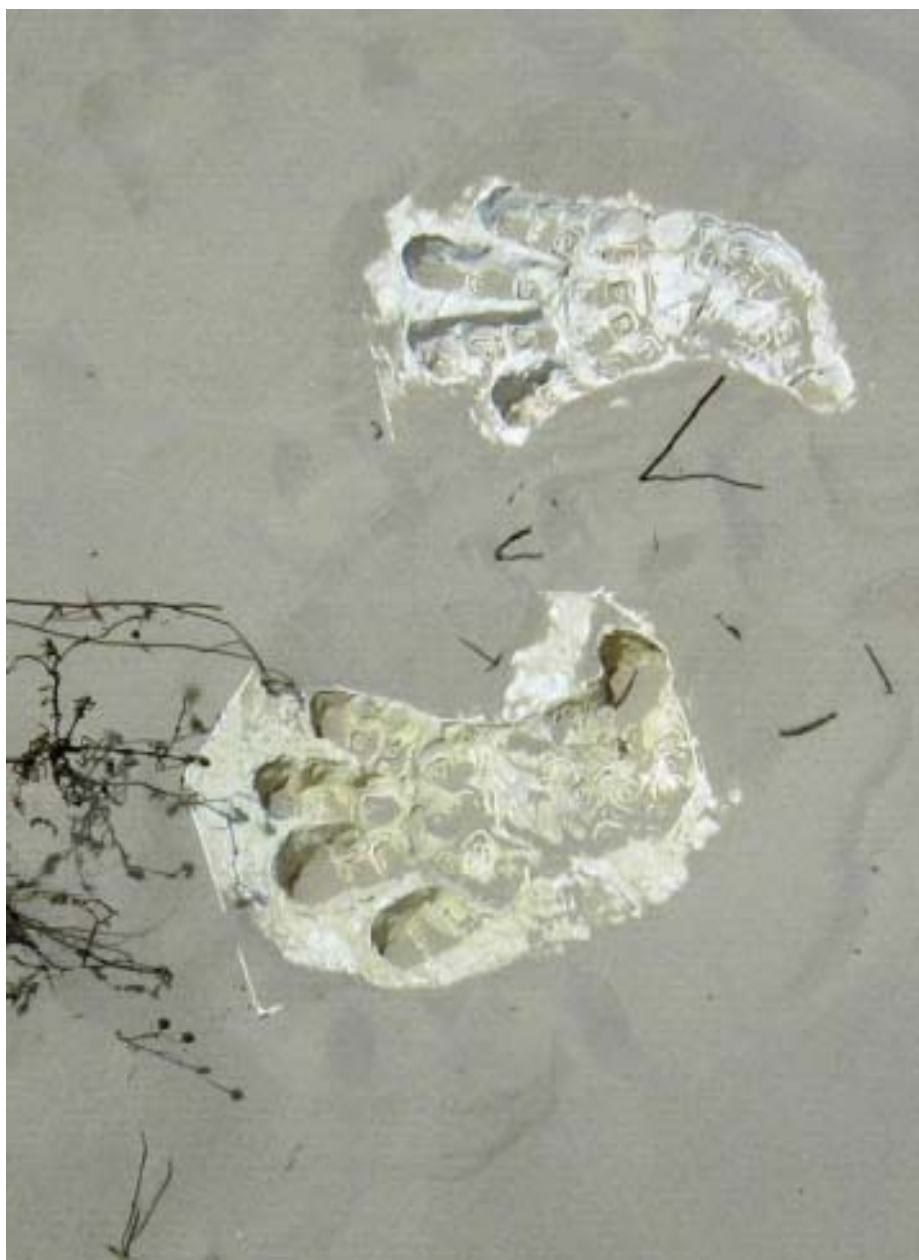
עקבות בחול, 2005, שיחזור גבס, חלולות קיסריה