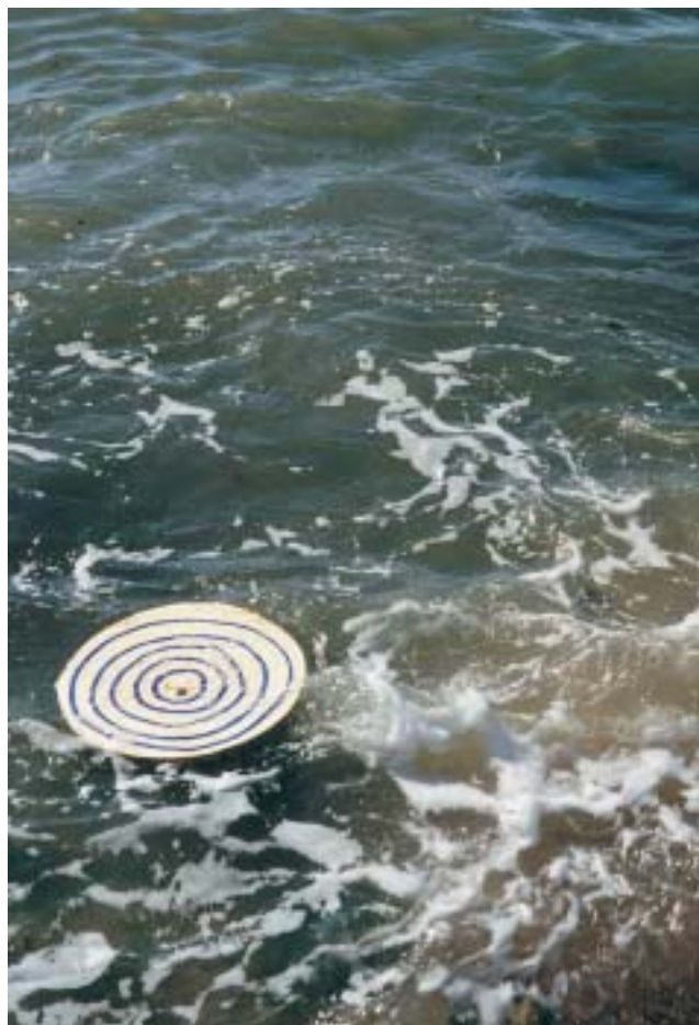
מערבולת , 2004, עט סימון על דיקט, חוף סידנא עלי