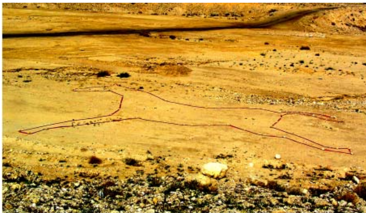
סוס כתום , 2005, סרט סימון, צילום מטופל, עמק זוהר סוס , 2005, סרט סימון, עמק זוהר