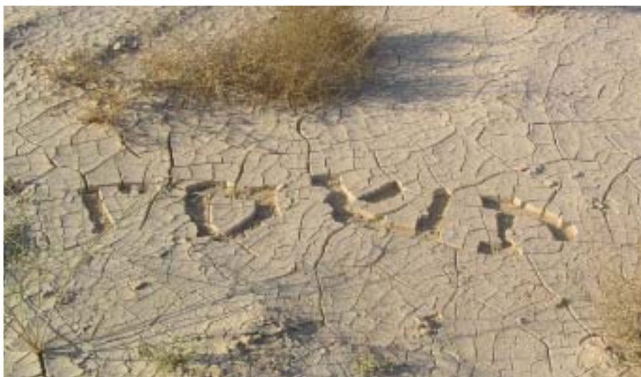
תשס"ו, 2006, עט סימון על דיקט, חוף עין בוקק תשס"ו, 2006, אדמה, ליד הסוללה של תעלת המים