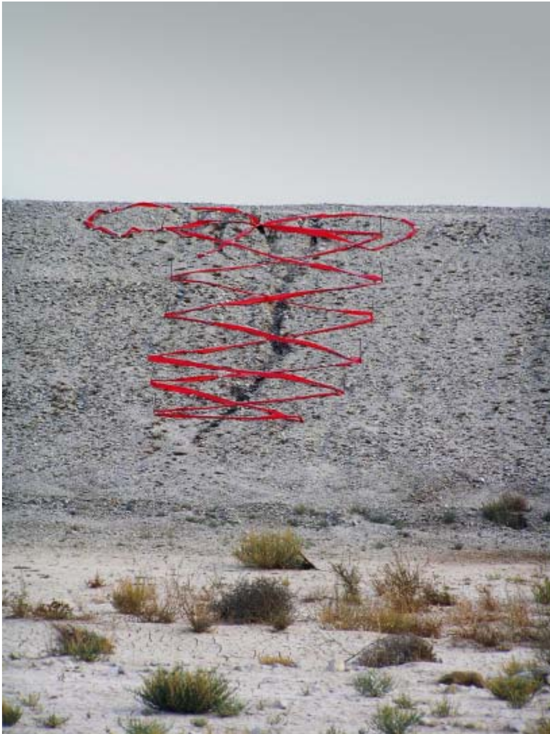
השרוך האדום, 2006, סרט סימון ויתדות (ענפים), תעלת המים מצפון לדרום