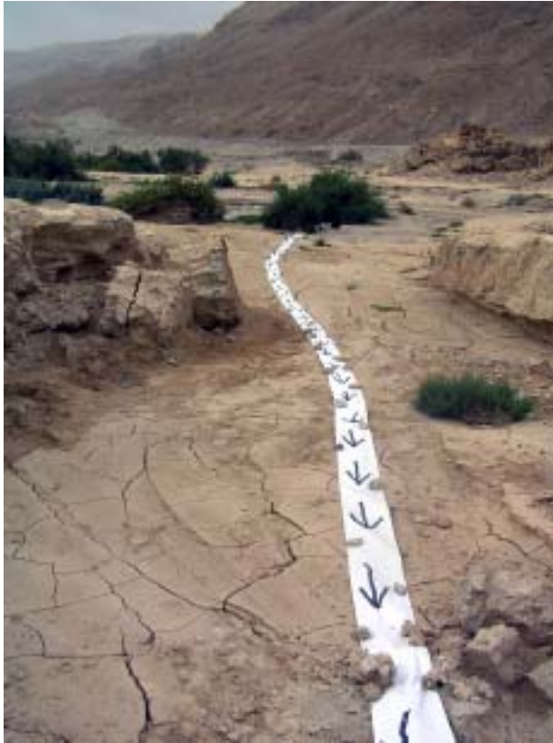
סימני דרך 2, 2005, עט סימון על נייר רציף, שפך נחל יעלים