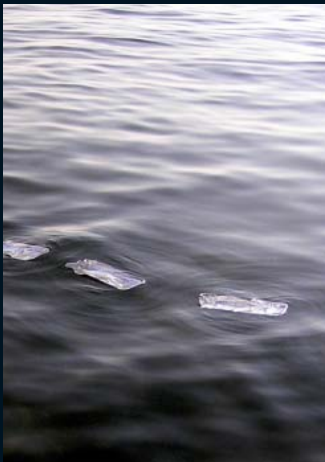
עקבות על המים, 2006, תבניות אלומיניום, חוף ימק"א