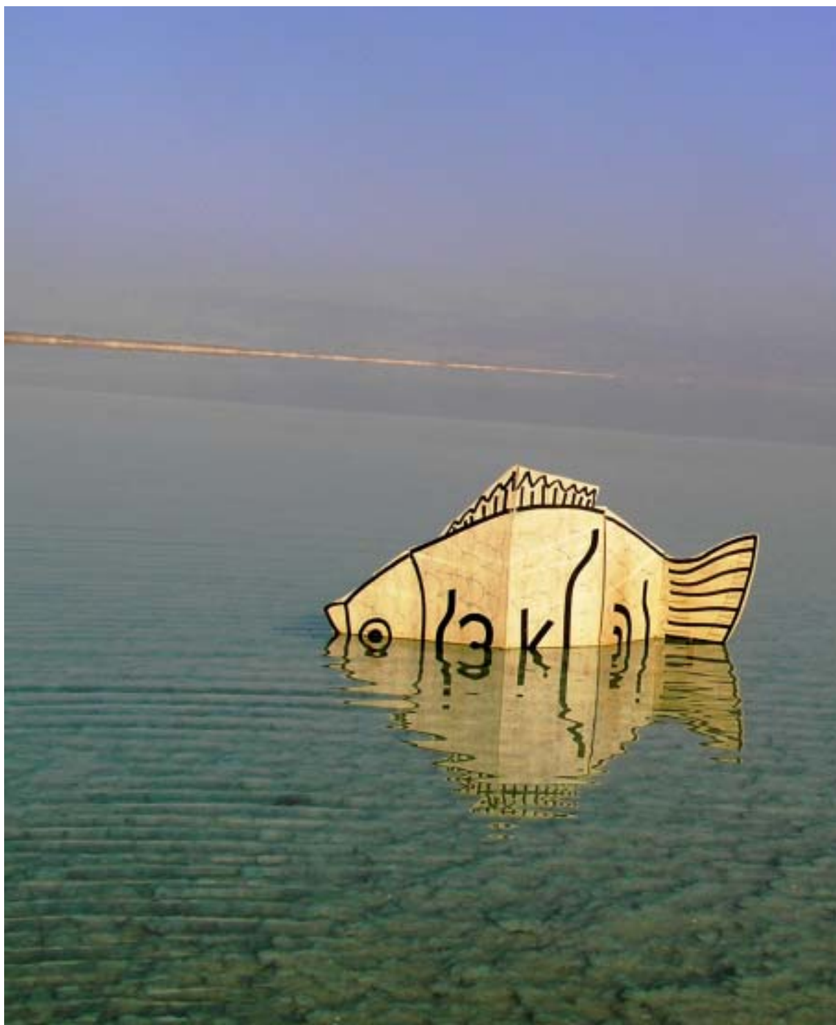
זה לא דג, 2006, עט סימון על דיקט, חוף עין בוקק