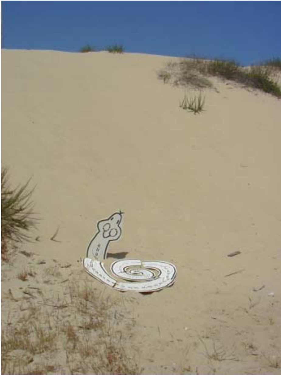
נחש , 2005, עט סימון על קרטון פלסטי, חולות אשדוד