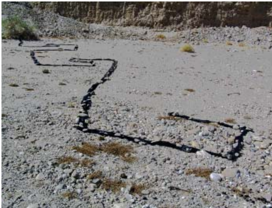
סוס כתום – קטע, 2005, סרט סימון, צילום מטופל, עמק זוהר פריז , 2006, סרט פקס שחור, עמק זוהר