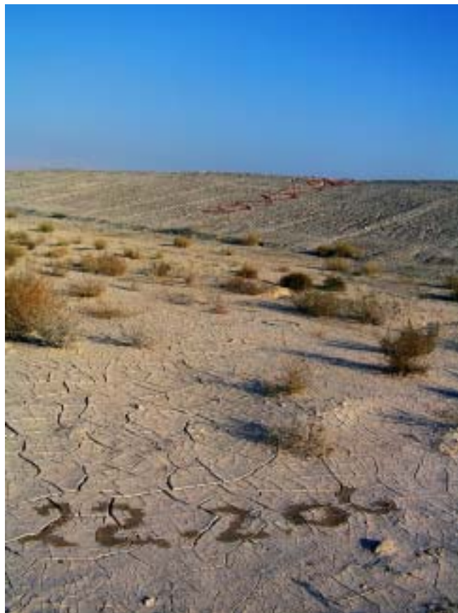
22.2.06, מים, ליד הסוללה של תעלת המים