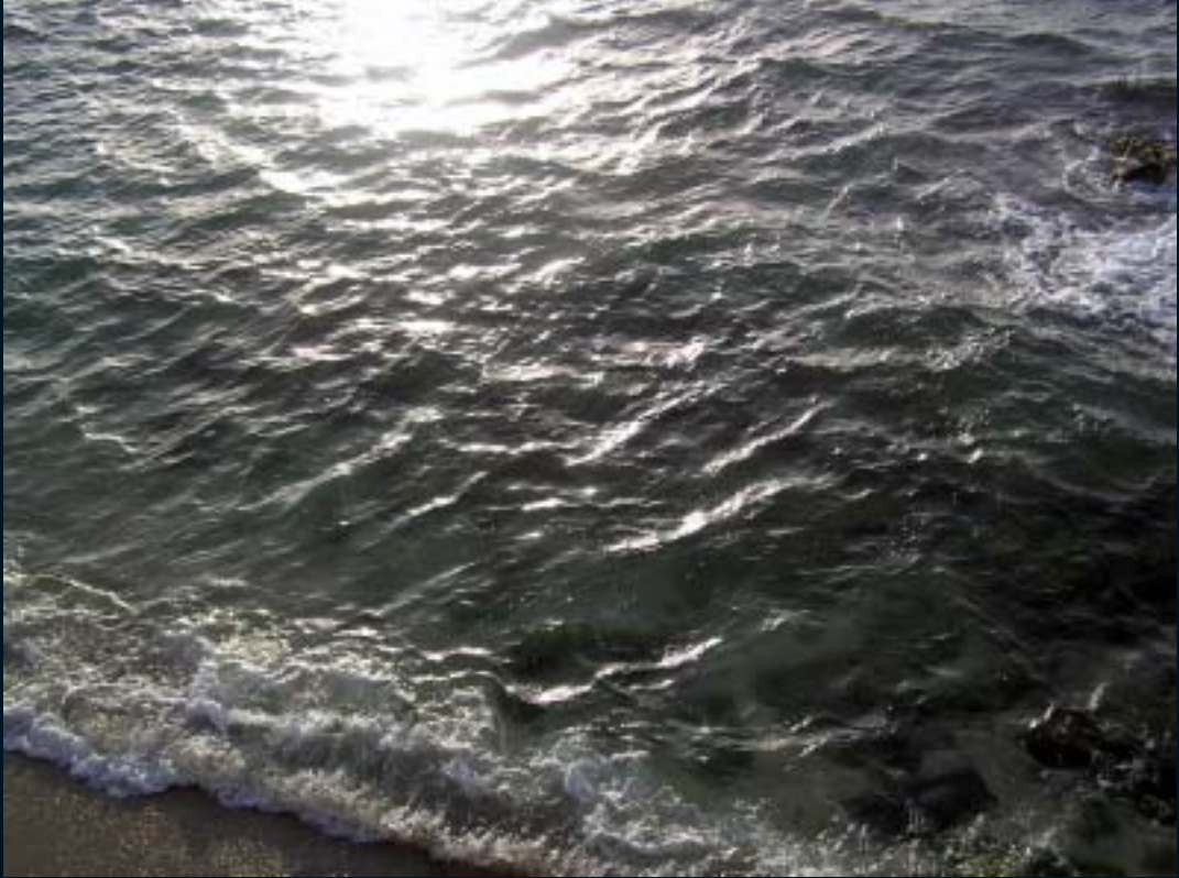
EHUD SCHORI "THREE SEAS"