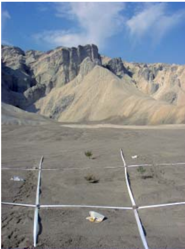
איקס עיגול, 2001, סרט סימון, עתונים ושיחים, נחל משמר