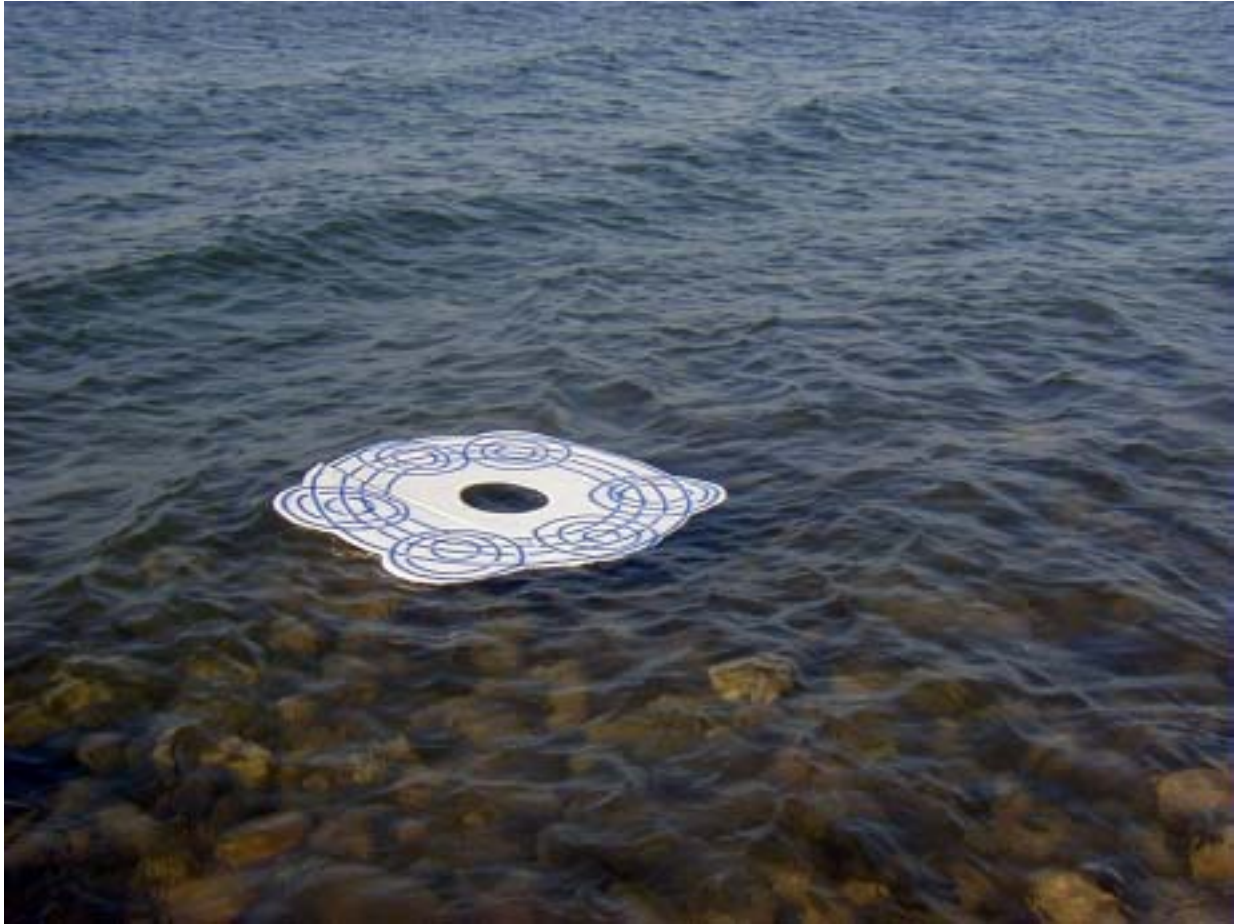
מעגלים , 2002, עט סימון על קרטון פלסטי, חוף חמי טבריה