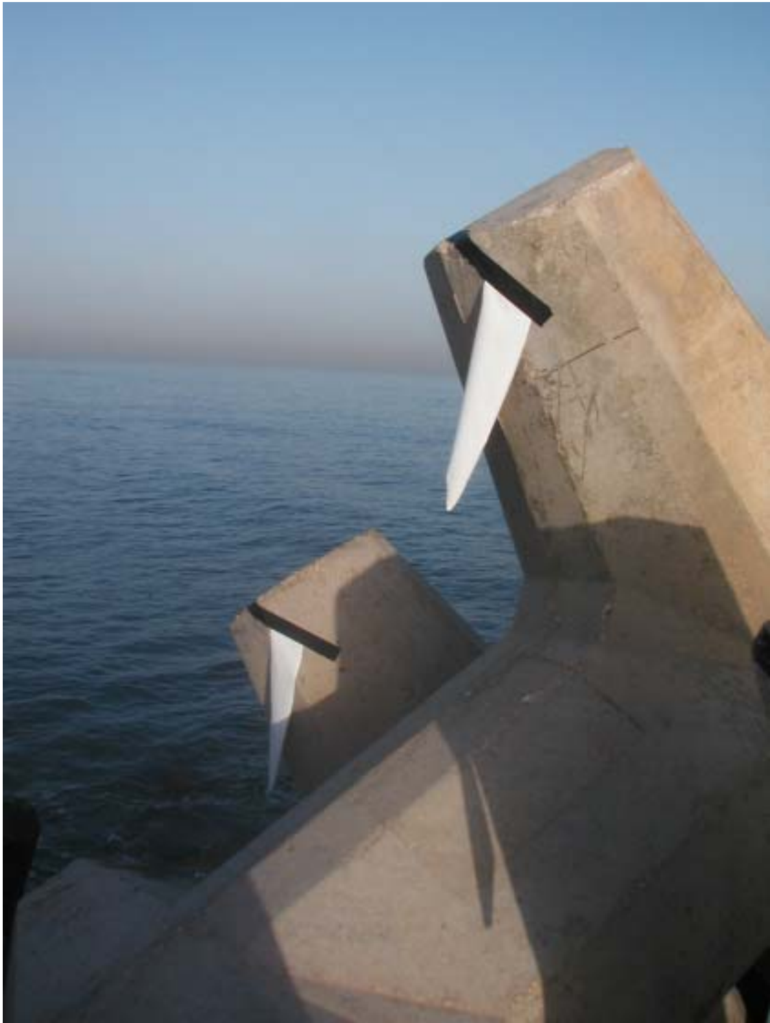
סוסי ים (ניבתנים), 2004, רצועות P.V.C. וסרט דביק, המרינה בהרצליה