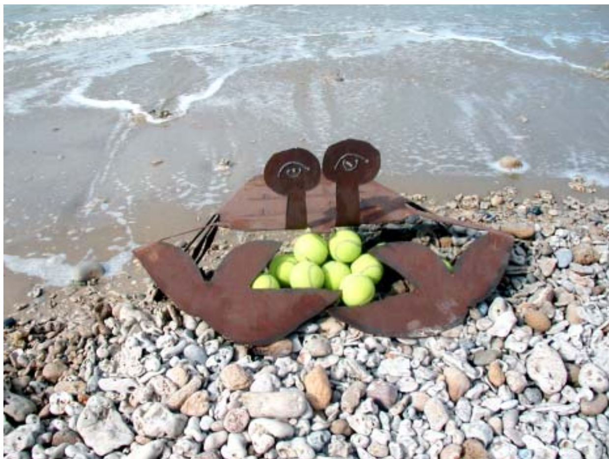
סרטן, 2004, מגזרת פח פלדה וכדורי טניס, חוף סידנא עלי