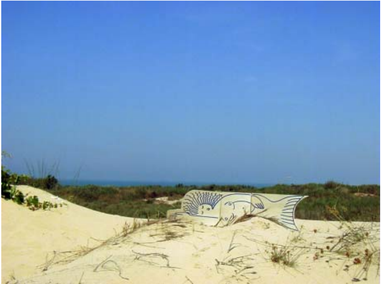
סירנה על החוף, 2005, עט סימון על דיקט, חולות אשדוד