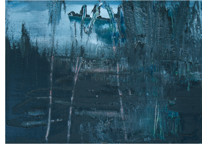
ישראל עם שמיים כחולים, 2011, שמן על בד, 19x26 ס"מ