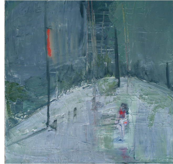
אישה ופנס, 2011, שמן על בד, 43x43 ס"מ