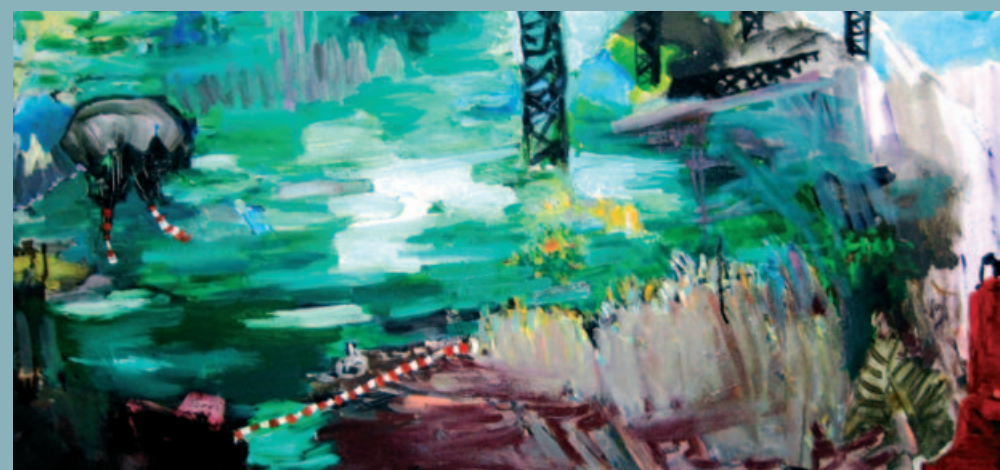
מצנח, 2009, שמן על בד, 110x50 ס"מ

בית האמנים ע"ש יוסף זריצקי, תל אביב רח' אלחריזי 9 ת"א, 64244. טל: 03-5246685 התערוכות בסיוע המועצה הציבורית לתרבות ואמנות, מדור לאמנויות פלסטיות