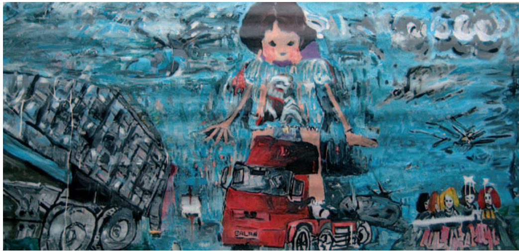
עם צעצועים, 2009, שמן על פח מגולוון 200x60 ס"מ

הסתובבה שם לבד. זה היה המקום הפרטי שלה - טבע פרטי בתוך טבע ציבורי, מעין מקום מסתור שבו יכלה להיעלם לכמה שעות, אזור דמדומים שטמן בחובו את הריגוש והשמחה, הסכנה והפחד.