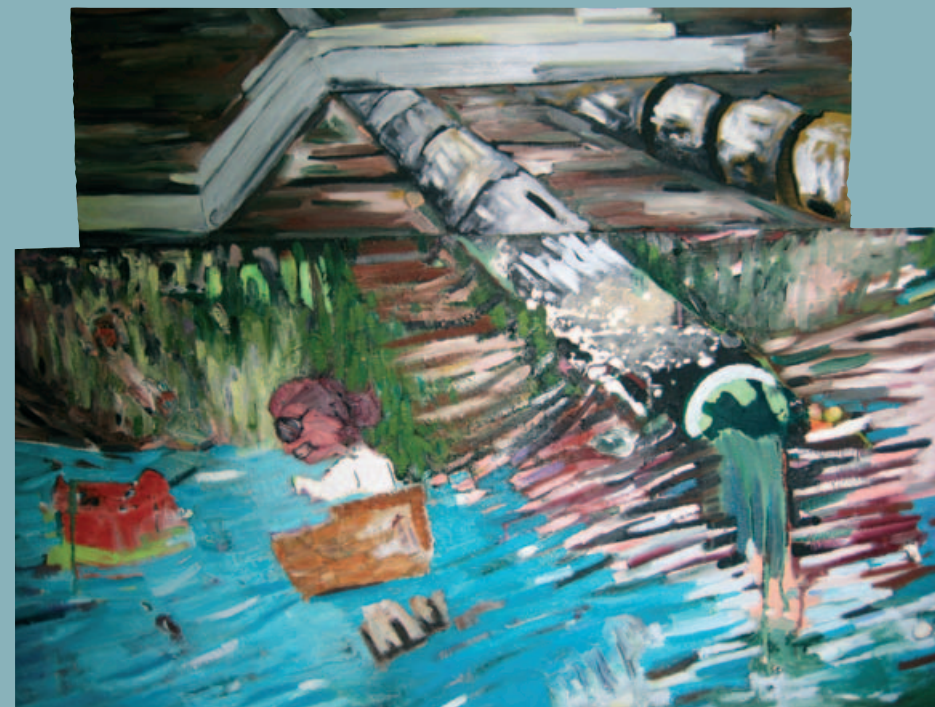
צינורות, 2009, שמן על שני דיקטים מחוברים, 122x96 ס"מ