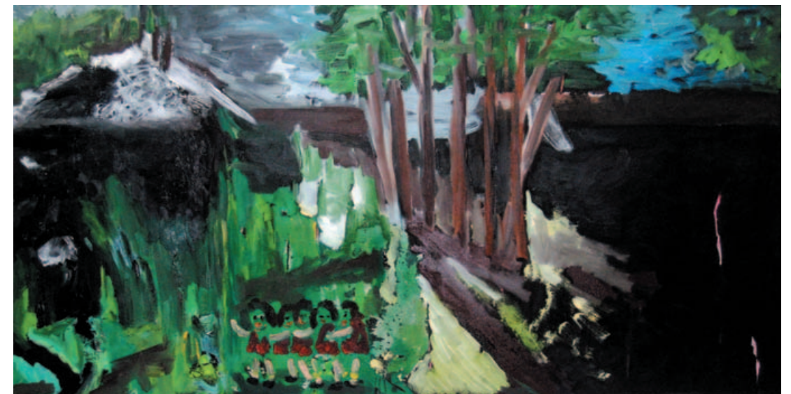
יער שחור, 2009, שמן על בד, 120x60 ס"מ

העבודות בתערוכה משקפות את המתח הקיים בין שייכות לבין זרות, בין טבע סוגר ומאיים מחד, לבין מקום מושך ומפתה, מאידך. המודעות לסכנה לא עצרה אותה מלהתקדם ולהמשיך רחוק יותר בהליכה של 3 ק"מ לעבר אזור עין יעל. החיפוש התמידי אחר מקומות חדשים הוביל לבחינה רפטיבית של הגבולות העצמיים. הידיעה שנחל הג'ורה הוא מקום מסוכן שלא מתאים לילדות קטנות, משכה אותה לעבר ניכוס הסכנה רק לעצמה. חבלות, או פצעים בברכיים היו הכרחיים לגיבוש הזהות שלה. מכיוון שלא גילתה לאף אחד על המקום, הוא נשאר בגדר סוד בינה לבין עצמה. תמיד